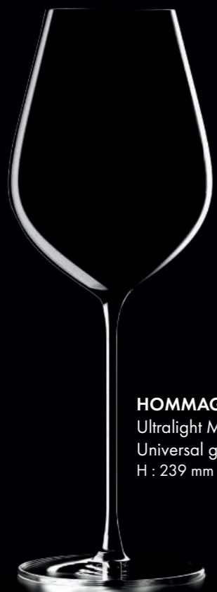
HOMMAGE 45 - 45 cl Ultralight Machine Made Universal glass H : 239 mm / Ø : 86 mm

"Tous les détails sont importants pour faire de la dégustation une symphonie sensorielle. Je voulais une collection qui exalte la convivialité des petites et grandes occasions."