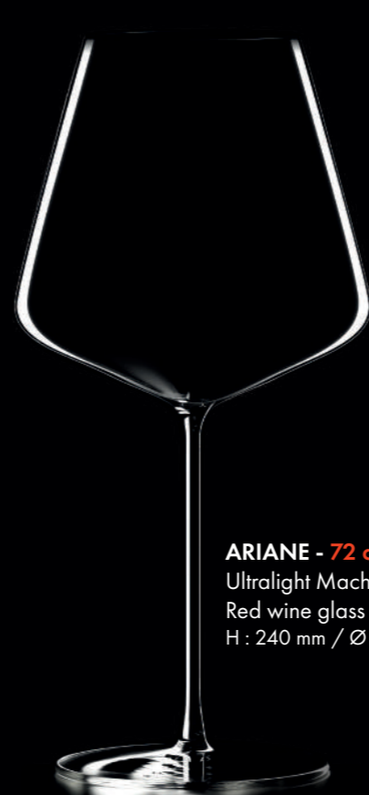
ARIANE - 72 cl Ultralight Machine Made Red wine glass H : 240 mm / Ø : 114 mm