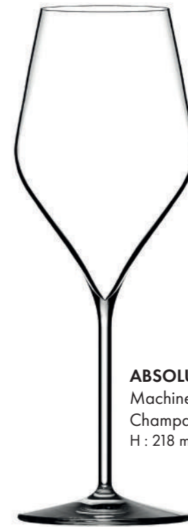
ABSOLUS 32 - 32 cl Machine made Champagne glass H : 218 mm / Ø : 78 mm