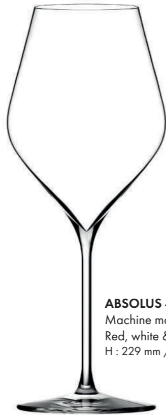
ABSOLUS 46 - 46 cl Machine made Red, white & rosé wine glass H : 229 mm / Ø : 92 mm

Universal & Modern, the Absolut collection glasses unveil elegant curves that will guide you through each tasting moment.