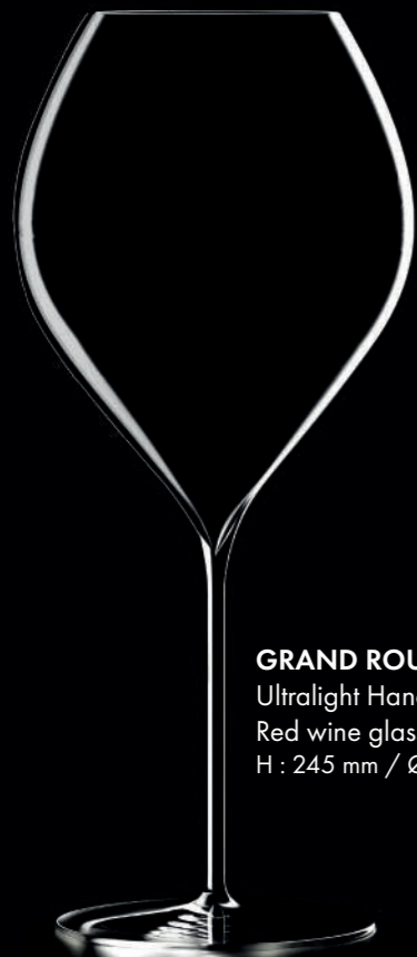
GRAND ROUGE - 70 cl Ultralight Handmade Red wine glass H : 245 mm / Ø : 106 mm