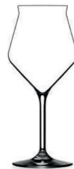
CRAFT - 44 cl Machine Made Beer glass H : 212 mm / Ø : 94 mm