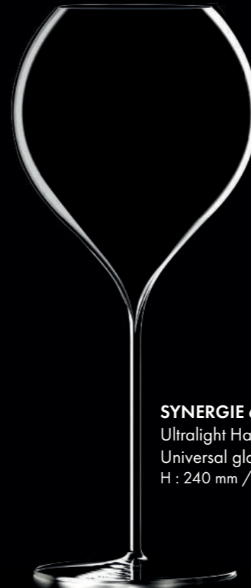
SYNERGIE 60 - 60 cl Ultralight Handmade Universal glass H : 240 mm / Ø : 104 mm