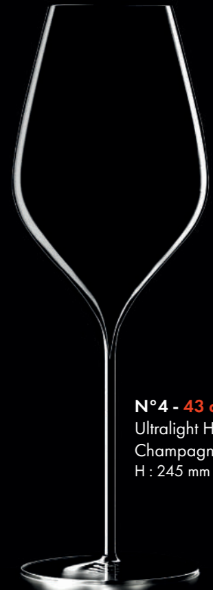
N°4 - 43 cl Ultralight Handmade Champagne glass H : 245 mm / Ø : 84 mm