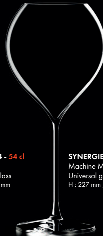
SYNERGIE 52 - 52 cl Machine Made Universal glass H : 227 mm / Ø : 100 mm