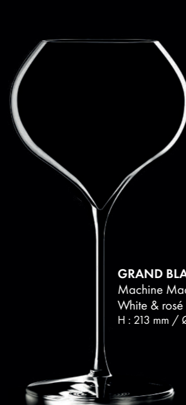
GRAND BLANC 54 - 54 cl Machine Made White & rosé wine glass H : 213 mm / Ø : 108 mm