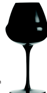
CENOMUST BLACK - 42 cl Machine Made Beer glass H : 203 mm / Ø : 100 mm