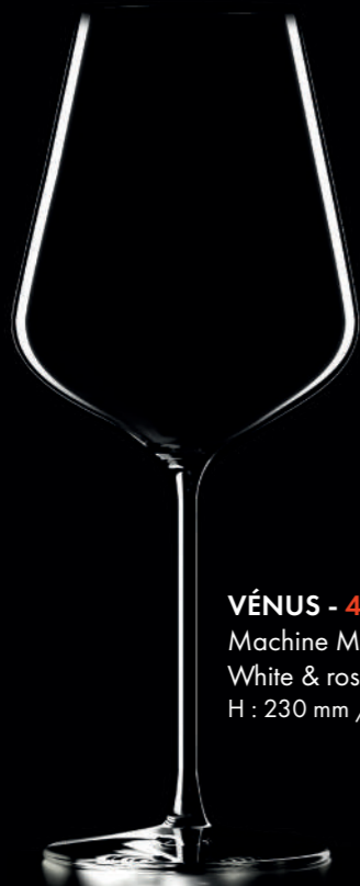
VÉNUMS - 47 cl Machine Made White & rosé wine glass H : 230 mm / Ø : 92 mm