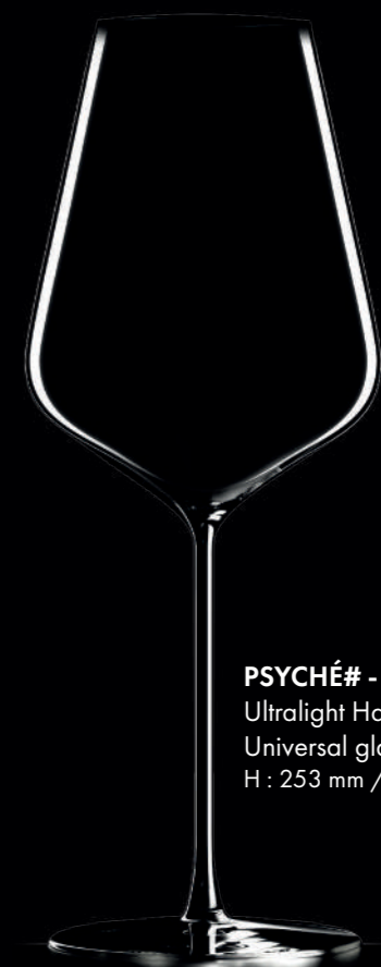
PSYCHÉ# - 65 cl Ultralight Handmade Universal glass H : 253 mm / Ø : 99 mm