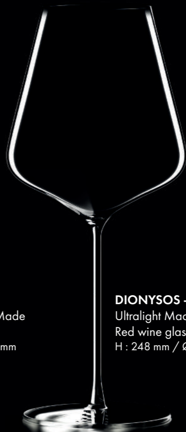
DIONYSOS - 66 cl Ultralight Machine Made Red wine glass H : 248 mm / Ø : 106 mm