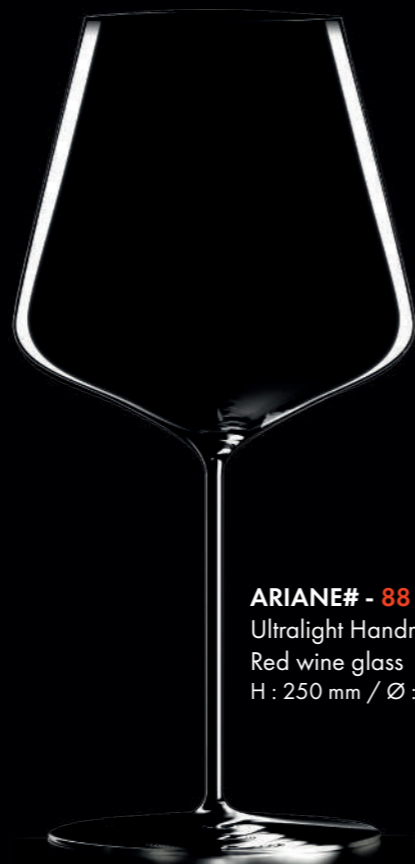
ARIANE# - 88 cl Ultralight Handmade Red wine glass H : 250 mm / Ø : 122 mm

Featuring pure & precise curves, the F.Sommier Collection delicately magnifies the Grand Crus' aromatic nobility.