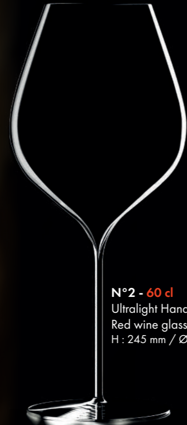
N°2 - 60 cl Ultralight Handmade Red wine glass H : 245 mm / Ø : 105 mm