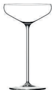
PARIS - 18 cl Handmade Spirits & cocktail glass H : 179 mm / Ø : 101 mm