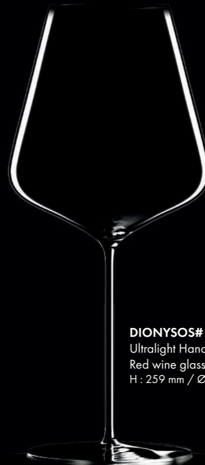
DIONYSOS# - 78 cl Ultralight Handmade Red wine glass H : 259 mm / Ø : 115 mm