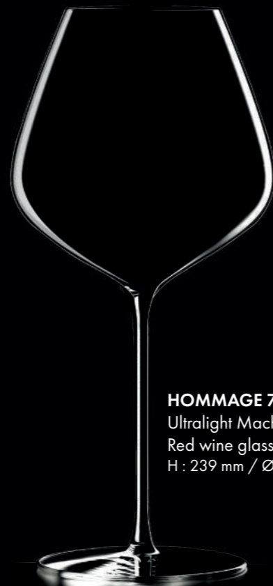
HOMMAGE 72 - 72 cl Ultralight Machine Made Red wine glass H : 239 mm / Ø : 111 mm

The G.Basset Collection's refined & pure lines celebrate the excellence of international wines and remind us that they are mostly a story of emotion and sharing.