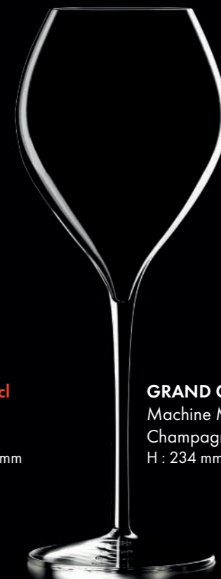
GRAND CHAMPAGNE 41 - 41 cl Machine Made Champagne glass H : 234 mm / Ø : 89 mm