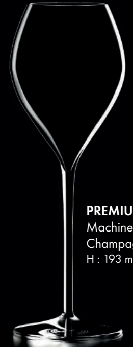
PREMIUM 18 - 18 cl Machine Made Champagne glass H : 193 mm / Ø : 67 mm