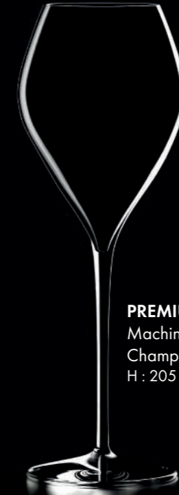
PREMIUM 23 - 23 cl Machine Made Champagne glass H : 205 mm / Ø : 73 mm