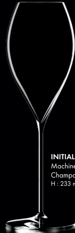
INITIAL 30 - 30 cl Machine Made Champagne glass H : 233 mm / Ø : 72 mm