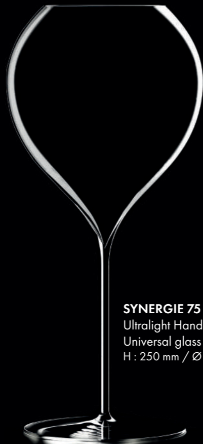
SYNERGIE 75 - 75 cl Ultralight Handmade Universal glass H : 250 mm / Ø : 115 mm

Elegant & spherical, the curves of the P.Jamesse Collection exquisitely unveil the colour shades, the energy and the fragrances of great wines.