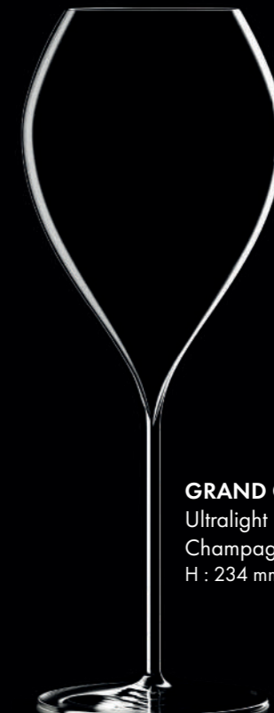
GRAND CHAMPAGNE 45 - 45 cl Ultralight Handmade Champagne glass H : 234 mm / Ø : 88 mm