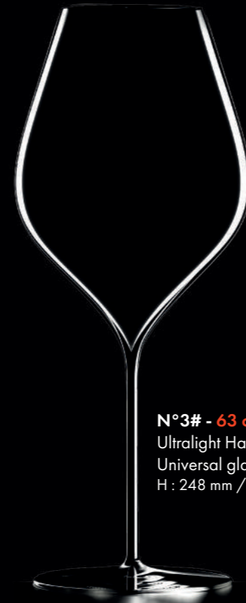
N°3# - 63 cl Ultralight Handmade Universal glass H : 248 mm / Ø : 100 mm