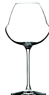
CENOMUST - 42 cl Machine Made Beer glass H : 203 mm / Ø : 100 mm