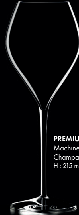
PREMIUM 28,5 - 28,5 cl Machine Made Champagne glass H : 215 mm / Ø : 79 mm