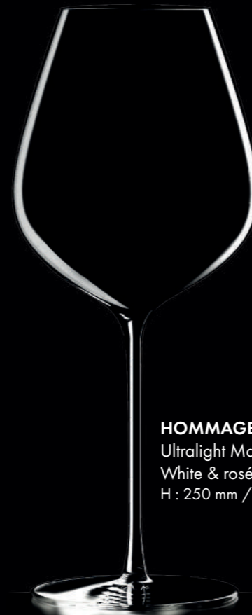
HOMMAGE 69 - 69 cl Ultralight Machine Made White & rosé wine glass H : 250 mm / Ø : 104 mm