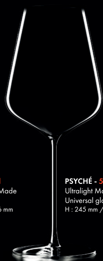
PSYCHÉ - 56 cl Ultralight Machine Made Universal glass H : 245 mm / Ø : 97 mm