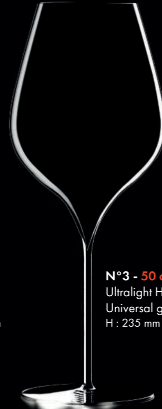
N°3 - 50 cl Ultralight Handmade Universal glass H : 235 mm / Ø : 92 mm