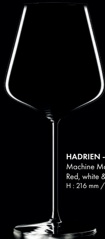
HADRIEN - 45 cl Machine Made Red, white & rosé wine glass H : 216 mm / Ø : 95 mm