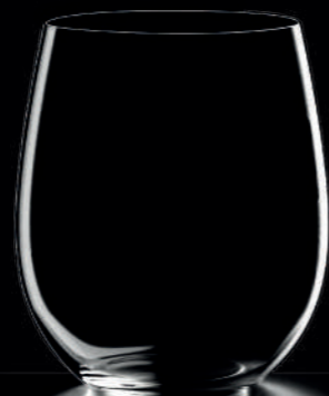
N°7 - 36 cl Ultralight Handmade Water & soft glass H : 98 mm / Ø : 82 mm

"Je m'attache à faire une cuisine très droite, très pure, sur le fil de l'acidité. J'ai voulu que ma collection soit à son image."