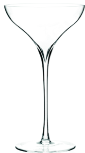
MONTRÉAL - 14 cl Handmade Spirits & cocktail glass H : 164 mm / Ø : 95 mm