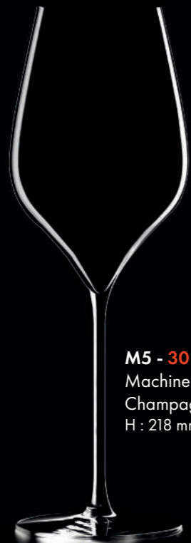
M5 - 30 cl Machine Made Champagne glass H : 218 mm / Ø : 74 mm