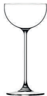
LONDRES - 19 cl Handmade Spirits & cocktail glass H : 177 mm / Ø : 85 mm